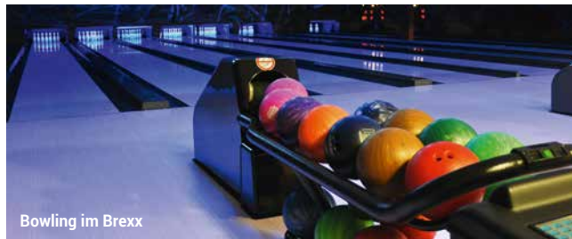
Bowling im Brexx